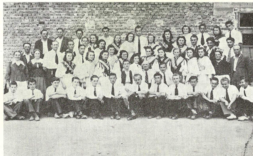
Sa kotarske smotre 1949. u Slav. Brodu

Prvi potpisnici su bili slijedeći drugovi: