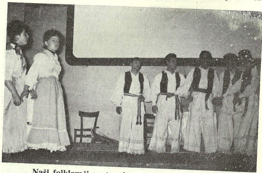
Naši folklorasi nastupaju u Andrijevcima 1951. g.