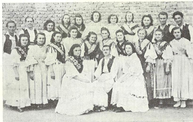
KUD »Stjepan Živić« na smotri u Slav. Brodu 1949.