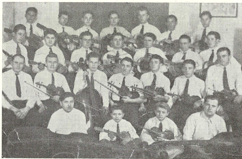
Tamburaški zbor 1948. g.

U predizbornom takmičenju društvo je dalo prestave u Garčinu i Vrpolju, a do izbora nastupali su i pred kolektivom Drvne industrije u Slav. Brodu. Kasnije se osniva i pionirska tamburaška sekcija. Društvo je tada brojalo 67 članova, od toga 30 seljaka i 19 radnika. Narodni orkestar je tada brojao 20 članova, sastav-