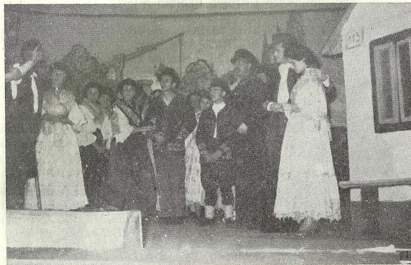
Scena iz »Inoča«

Dom kulture odvojilo 70000 starih dinara. — Dovršenjem doma društvo je steklo sve uvjete da se razvije u najbolje društvo ne samo u kotaru, već i u Republici.