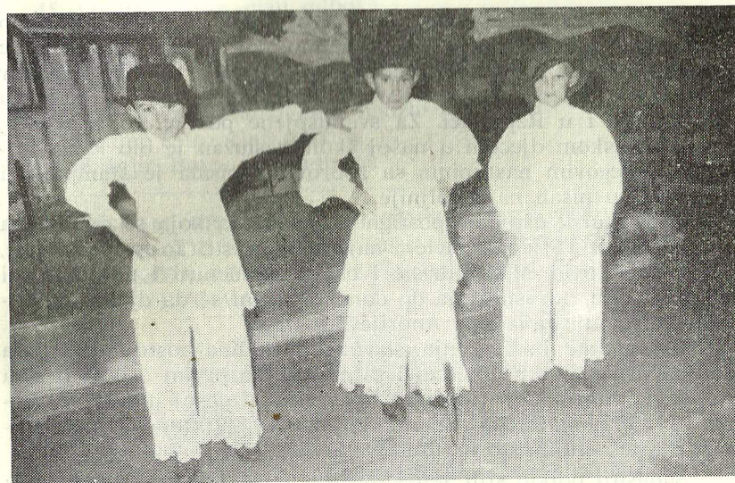
»Momačko podigravanje« za Dan Republike 29. novembra 1964. g.