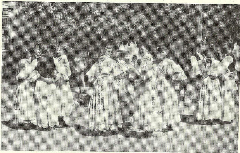
Sa nastupa u Puli 1950. g.

Za rajonsku smotru 1951. godine dramska sekcija spremila je Nušićevu komediju »VLAST« gdje je opet pokazala da se može zalaganjem svih članova postići zavidni rezultati. Kako se približavala i kotarska smotra u Slav. Brodu, dramska sekcija je uvježbavala »GOSPOĐU MINISTARKU« od B. Nušića te ju sa uspjehom na kotarskoj smotri izvelo i opet pokupilo lovorike. Svojim čestim nastupima i renome koji je postigla, financijski je bilo najjače, tako da je za izgradnju Zadružnog doma, današnji