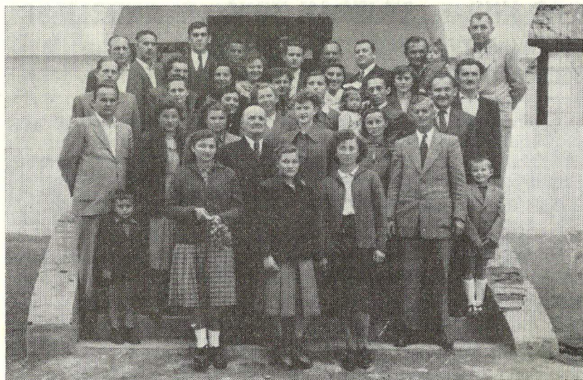
Prvi članovi i rukovodioci društva

Godine 1949. družina prerasta u kulturno-umjetničko društvo i uzima ime palog borca u NOR-u Stjepana Živića iz D. Andrijevac. — Napredni drugovi iz Andrijevaca osnivaju »Inicijativni odbor«, zatim deset drugova zahtjeva pismenim putem od SUP-a u Slavonskom Brodu da se odobri rad društva pod nazivom »Stjepan Živić«. Svojim potpisima garantiraju da će se društvo isključivo baviti širenjem kulture u selu i van njega.